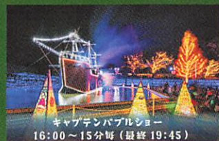
キャプテンパブルショー 16:00~15分毎(最終19:45)