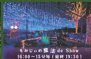
もみじの魔法 de Show 16:00~15分毎(最終19:30)